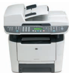
HP LaserJet M2727nf MFP