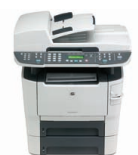
HP LaserJet M2727nfs MFP